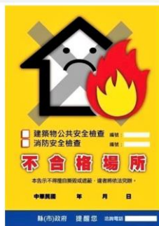
建築物公共安全檢查及消防安全檢查不合格張貼告示